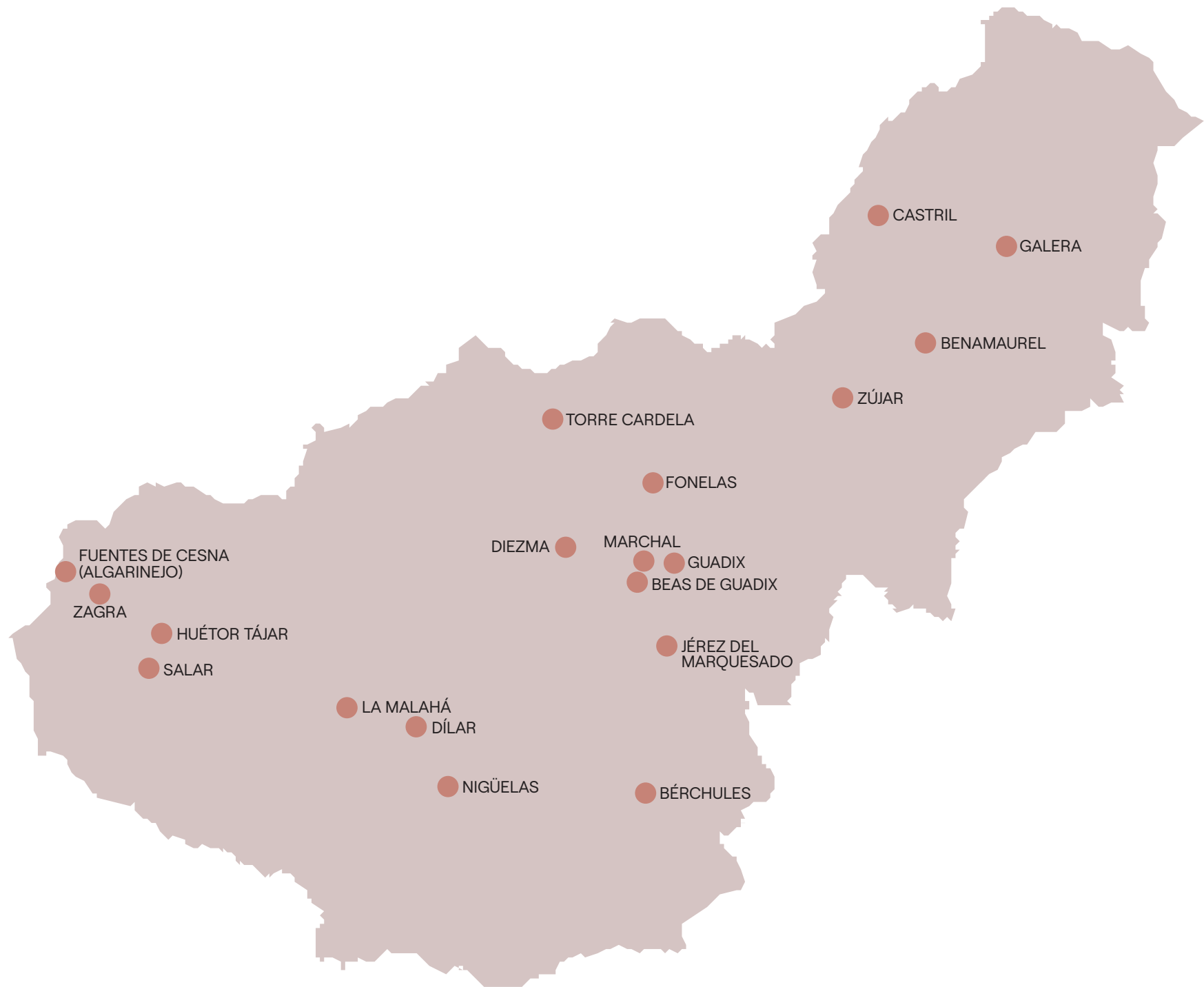
Mapa de actuaciones de la provincia de Granada.