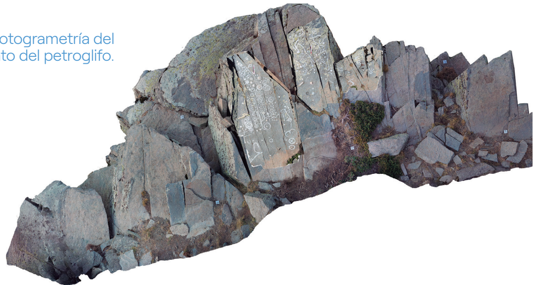
Fotogrametría del conjunto del petroglifo.

Se llevó a cabo un vuelo de dron para la realización de una documentación fotográfica del petroglifo y su entorno, así como servir de apoyo a otras fases de documentación.